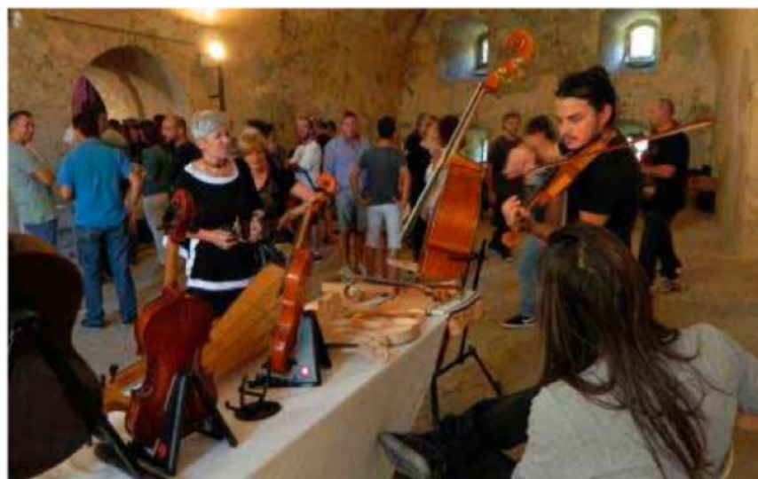
Alcuni stand di strumenti acustici e ad arco nelle case matte della cerchia muraria di Pizzighettone per la manifestazione Music Wall

batterie, bassi, violini amplificati, effetti e amplificatori, accessori, abbigliamento ed editoria specializzata. Chiunque poteva provare e improvvisare, trovandosi a suonare accanto a chi ha fatto della musica una professione, agli artisti che si sono esibiti sul palcoscenico principale allestito nella